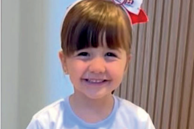
Aniversariantes da semana