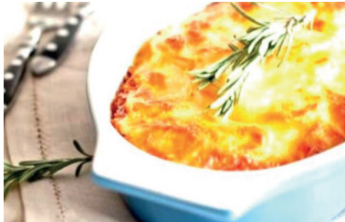
Bruna na Cozinha