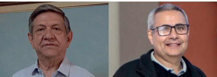
Prefeito e vice são investigados em uma ação eleitoral por distribuírem de kits de higiene e pares de tênis para alunos da rede municipal no período das Eleições

“Considerando-se que a concessão de efeito suspensivo pressupõe a probabilidade de êxito do recurso especial, materializada pelo juízo positivo de admissibilidade, o