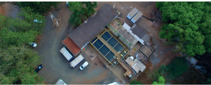
Estação de Tratamento de Água (ETA) - Somente no primeiro semestre deste ano, mais de 23 mil análises foram realizadas desde a captação até a distribuição nas torneiras