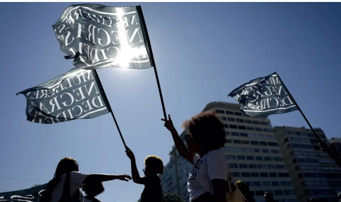
Levantamento analisou 4.838 decisões judiciais publicadas no período de janeiro a outubro

Os dados reunidos, segundo as pesquisadoras, reforçam a necessidade de políticas públicas específicas para enfrentar práticas discriminatórias em ambientes profissionais e outros espaços de convivência no país. A divulgação da pesquisa dialoga com esse esforço e os atos em defesa da população afrodescendente no Brasil, que ganham destaque neste 20 de novembro, Dia da Consciência Negra.