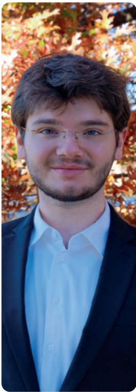
POR: FELIPE CICOLIN VITTE RELAÇÕES INTERNACIONAIS

Nos Estados Unidos, o debate sobre a liberdade de expressão nos campi é sinônimo de controvérsia. O estado da convivência discente nas instituições de ensino superior, já convulsionado, foi agravado com a interferência do Presidente Trump após seu retorno à Casa Branca.