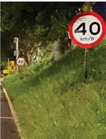
Radar começou a operar na cidade na primeira hora da última quarta-feira (12)

ativação, o total de equipamentos em operação nas rodovias não concedidas chega a 467. O radar faz parte do contrato do Edital nº 145/2023, que prevê a implantação de 649 radares em pontos estratégicos ao longo dos mais de 12 mil quilômetros de rodovias estaduais não concedidas. Segundo do DER, a escolha de cada ponto de radar resulta de mapeamento técnico que considera histórico de acidentes, excesso de velocidade, características da via, pontos críticos e áreas de travessia de fauna.