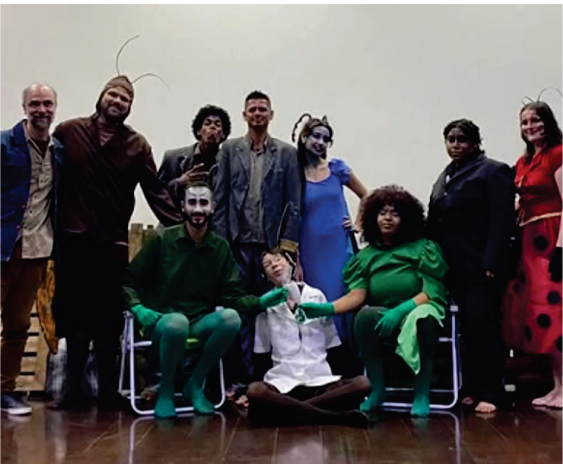
Os interessados devem chegar no local com no mínimo 20 minutos de antecedência