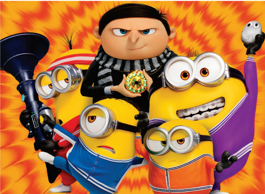
O Cine Céu é um projeto de cinema itinerante movido a energia solar, que une arte, cultura e sustentabilidade