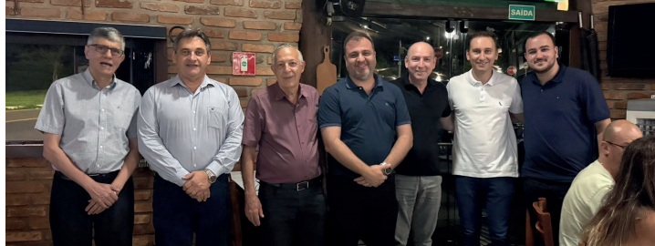
Confraternização no Deck foi a última atividade realizada pela Acisg neste ano

Atividade foi a última da Associação Comercial e Industrial de Santa Gertrudes (Acisg), que realiza neste final de ano a campanha Natal Premiado. O evento aconteceu no último dia 12 no Deck Churrascaria e reuniu membros da diretoria e associados. Página 6