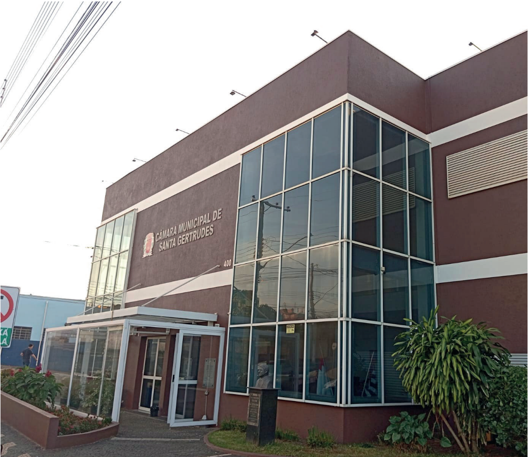
No total, Câmara devolveu ao Executivo R$ 570.616,78 de seu orçamento no final de dezembro de 2025

Uma novidade importante implementada no último ano foi a periodicidade da devolução do duodécimo. Atendendo a orientações do Tribunal de Contas do Estado de São Paulo (TC-SP), os valores economizados foram repassados à Prefeitura a cada dois meses, e não apenas