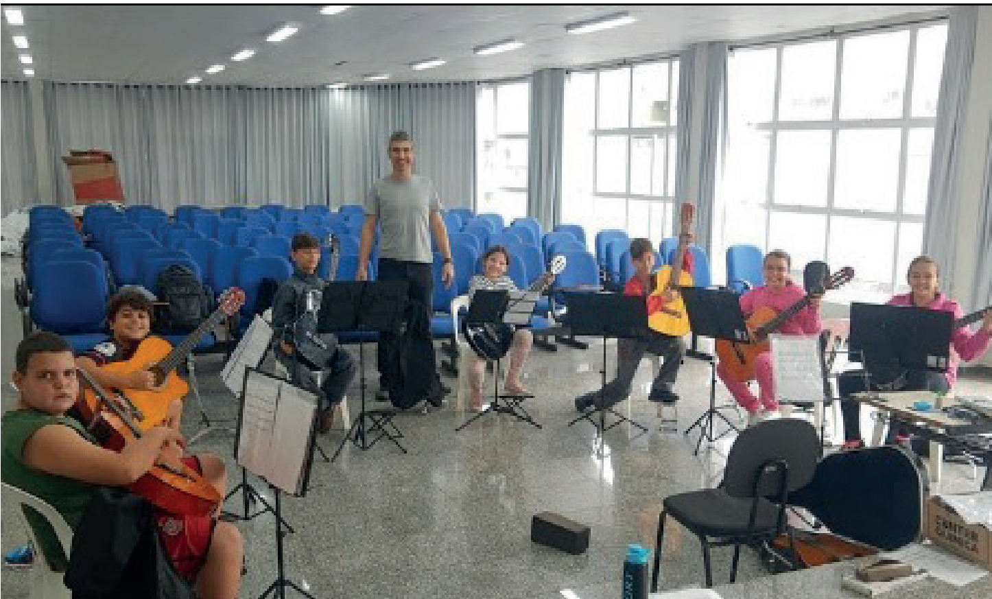
Serão oferecidas oficinas de Artes Plásticas; Fotografia e Cinema; Violão e Canto Coral; Teatro e Circo; e Libras (Língua Brasileira de Sinais)

serão realizadas em diversos pontos estratégicos, utilizando equipamentos públicos para aproximar a arte da comunidade. Entre os locais confirmados estão o Centro Cultural, o Teatro Municipal, as unidades do CRAS e a Escola de Dança. Segundo os organizadores, o objetivo vai além do ensino técnico: busca-se fortalecer os vínculos de convivência e promover a educação cidadã por meio da expressão artística. As oficinas são totalmente gratuitas. Os interessados devem ficar atentos aos canais oficiais da secretaria de Cultura e Prefeitura Municipal entre hoje (16) e segunda-feira (19) para conferir os horários das aulas e os documentos necessários para a inscrição.