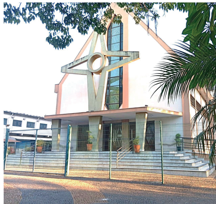
O evento, sediado no Pátio da Matriz São Joaquim e Santa Gertrudes, combina celebrações religiosas com atividades culturais e a tradicional quermesse

As atrações musicais são um dos destaques da festa