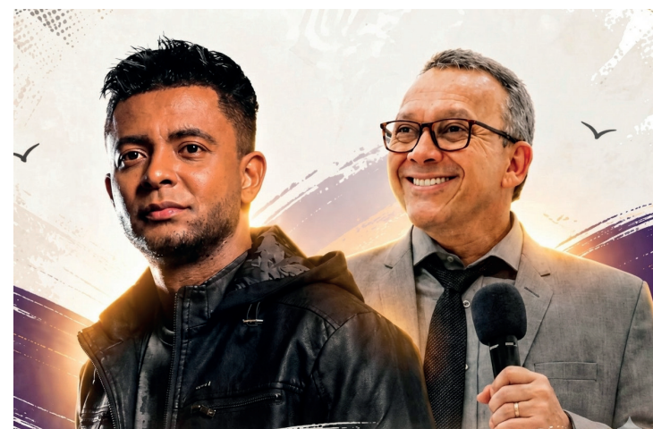
A Marcha para Jesus terá início na Praça da Bíblia, localizada na Rua 18, no Jardim Parque Industrial