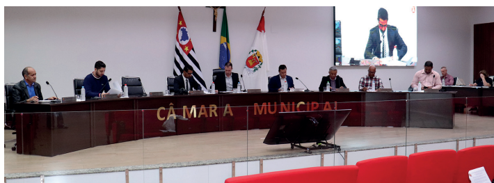
A próxima sessão ordinária acontece no dia 1 de junho, às 18 horas, no Plenário Cyria Hansen

A Câmara Municipal de Santa Gertrudes aprovou o repasse de R$ 280 mil para a Secretaria de Obras e Serviços Públicos, que serão aplicados na construção de 20 unidades habitacionais pelo programa Minha Casa, Minha Vida. Página 4