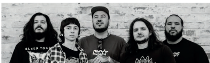
Banda Noise apresenta os clássicos do gênero New Metal

O espaço alternativo recebe neste sábado (23) o show da banda Noise no palco Zé Jardim. Com abertura dos portões programada para as 20 horas e início da apresentação às 21h30, o grupo preparou um repertório focado em clássicos internacionais do gênero New Metal, incluindo interpretações de Linkin Park, System of a Down, Deftones e Korn. Os ingressos serão vendidos na portaria. Página 6