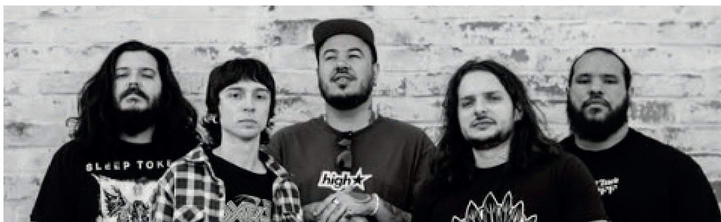
Banda Noise apresenta os clássicos do gênero New Metal

O evento acontece na Rua 2, número 334, no Centro. A abertura dos portões está programada para as 20h, com o início do show da banda Noise previsto para as 21h30. Os ingressos para a apresentação estarão disponíveis diretamente na portaria do local pelo valor de 15 reais.