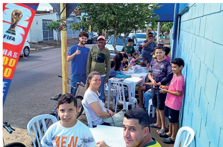
Atividade acontece no Supermercado Rodrigues neste sábado (23), das 8 às 12 horas