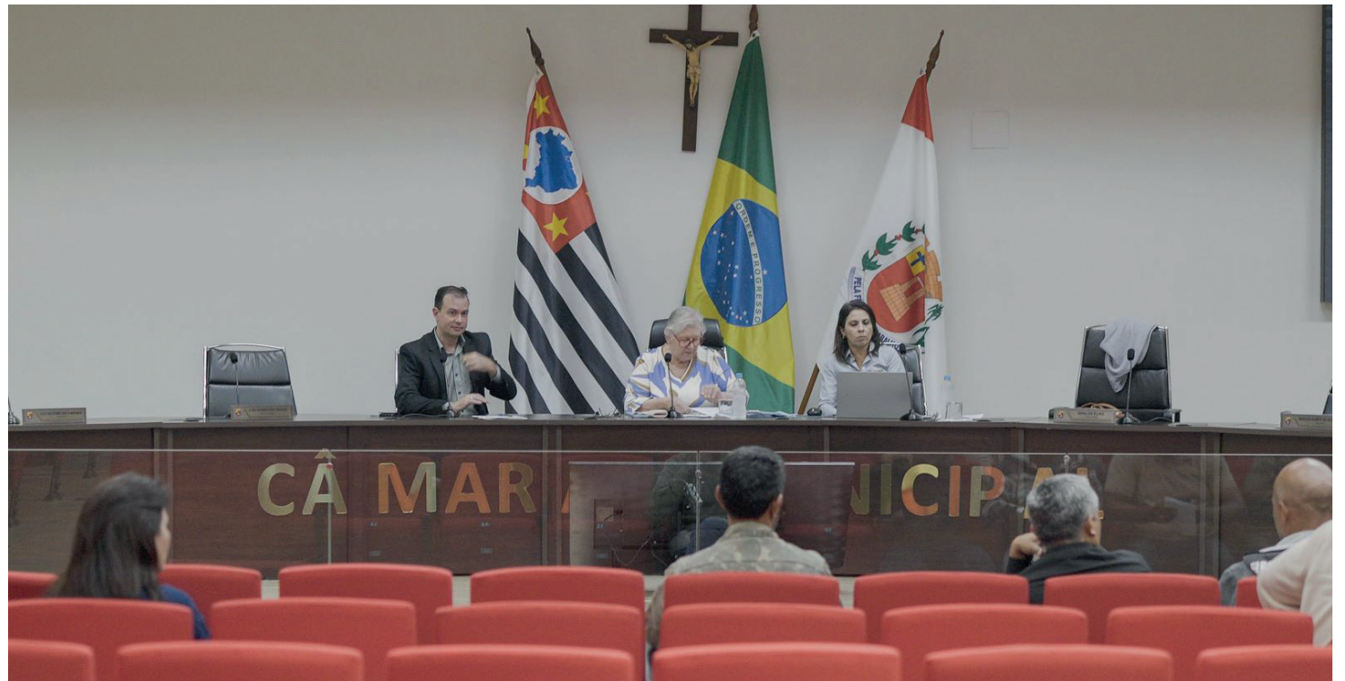
O evento ocorrerá de forma híbrida: tanto na sede do Legislativo, quando via internet

A LDO atua como um elo técnico entre o Plano Plurianual (PPA) e a Lei Orçamentária Anual (LOA). O documento fixa as regras para a elaboração do orçamento do próximo ano, estabelecendo previsões de receitas, limites para despesas e diretrizes para o equilíbrio fiscal do município.