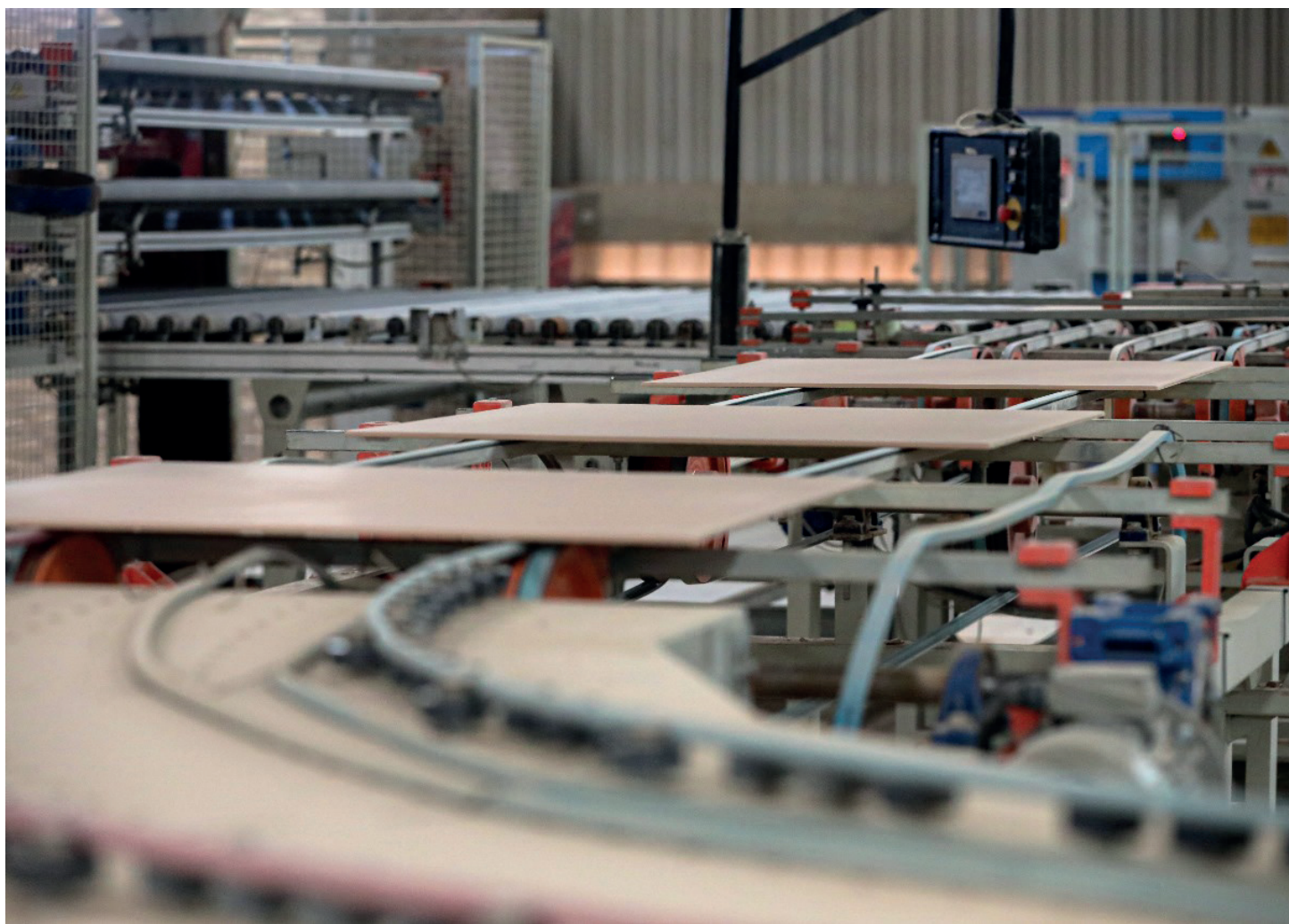
Essa pujança econômica se traduz diretamente em desenvolvimento social e geração de renda para a população regional

Essa pujança econômica se traduz diretamente em desenvolvimento social e geração de renda para a população regional. O setor é responsável pela manutenção de mais de 12 mil empregos diretos nas indústrias, além de mobilizar cerca de 40 mil vagas indiretas em toda a cadeia produtiva, englobando transportadores, mineradoras, fornecedores de insumos químicos e prestadores de serviços mecânicos. O grande diferencial competitivo que sustenta essa estrutura está sob a terra. A formação geológica Corumbataí fornece uma das melhores argilas do mundo para a fabricação de pisos pelo método de via seca, um processo que utiliza a moagem do mineral sem a adição de água, garantindo alta eficiência energética e liderança em custo formativo.