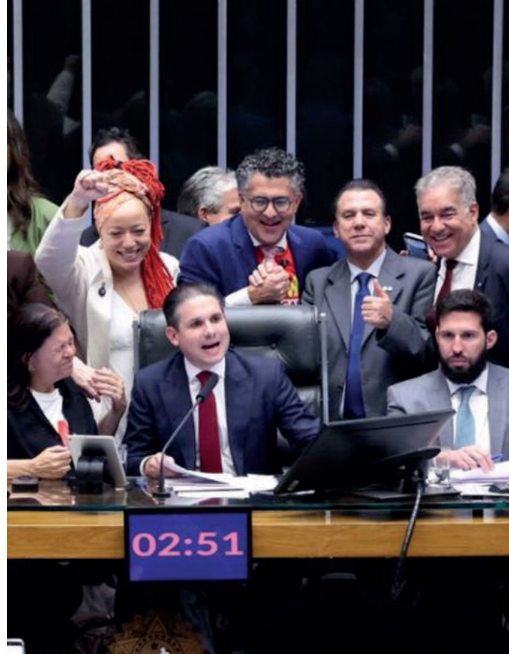
A transição foi incluída após um acordo do governo com o presidente da Câmara dos Deputados

Saiba todos os pontos da PEC acessando o portal www.sgon.com.br .