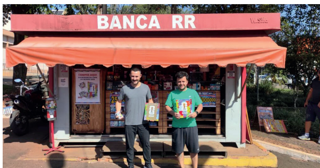
O encontro na Banca RR reforça a tendência crescente em Santa Gertrudes de colecionismo da Copa

O encontro na Banca RR reforça uma tendência crescente em Santa Gertrudes. O movimento em torno do colecionismo tem ganhado fôlego no município, com eventos similares registrados recentemente, como o ocorrido no Supermercado Rodrigues no último dia 23 de maio. Com a proximidade do início do Mundial, a previsão é que a busca por trocas presenciais se intensifique, consolidando a prática como um fenômeno cultural e social no município.