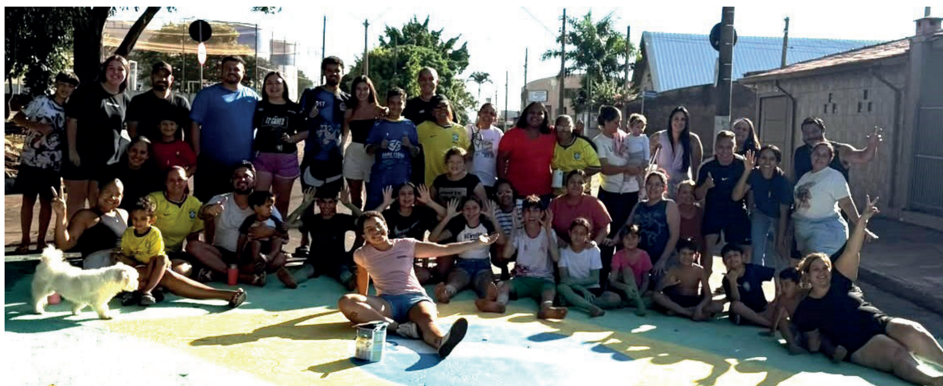
Uma das pinturas fica na Rua Santa Isabel, no Jardim Maria Lígia

Decoração no asfalto com as cores da seleção resgata memórias de família e promove a união comunitária nos bairros Jardim Maria Lígia e Centro. Página 6