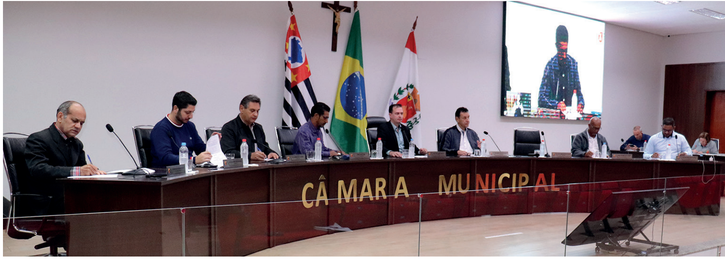
A próxima sessão ordinária será dia 15 de junho, às 18 horas, no Plenário Íria Hansen

Outros cinco projetos, todos de autoria do Prefeito, foram discutidos durante a ordem do dia da sessão ordinária. Em primeira votação, foi aprovado o Projeto de Lei 28/2026, que dispõe sobre as Diretrizes Orçamentá-