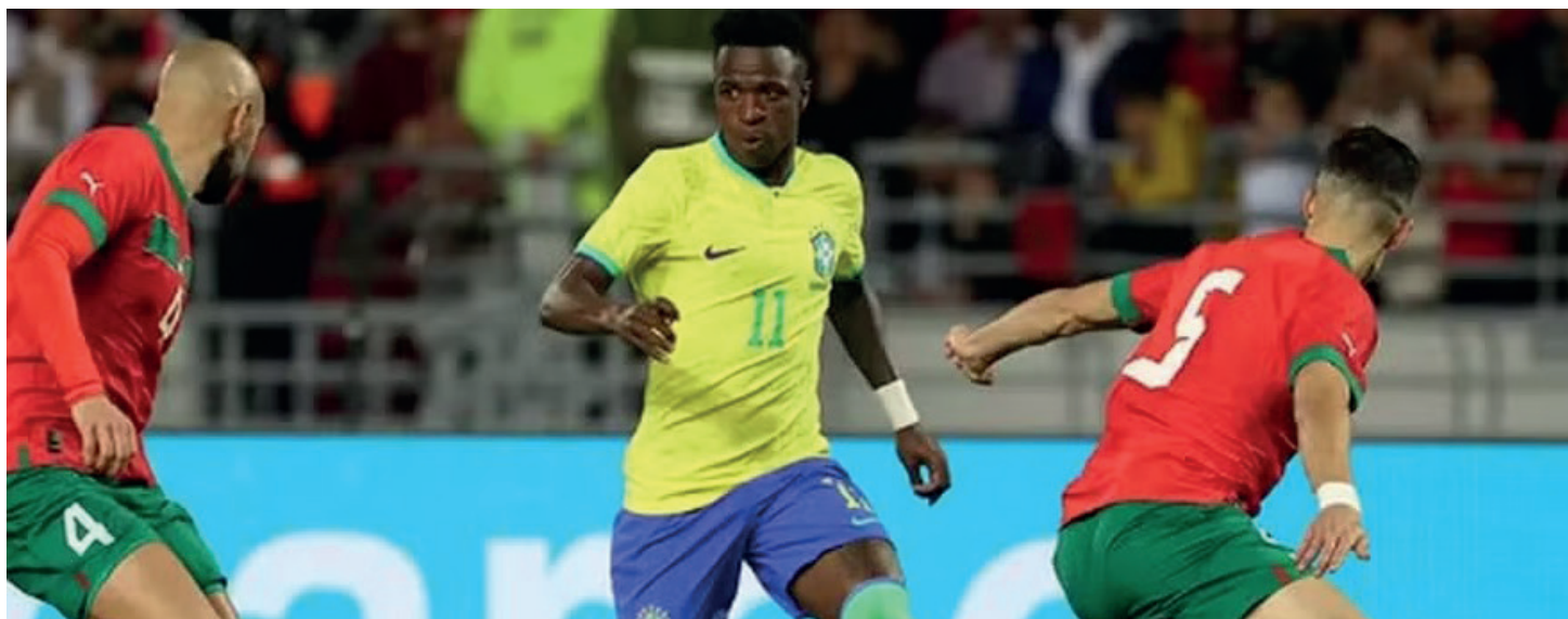
Brasil perdeu para o Marrocos em 2023, mas ganhou na Copa de 1998

Para o encerramento das atividades, está previsto um show musical com o artista Zé Ramalho Cover (Kaiser), a partir das 21 horas. A estrutura montada no parque contará ainda com uma praça de alimentação e uma área dedicada ao público infantil (Área Kids), visando oferecer suporte aos cidadãos que comparecerem ao local para acompanhar a exibição esportiva e as atrações culturais.