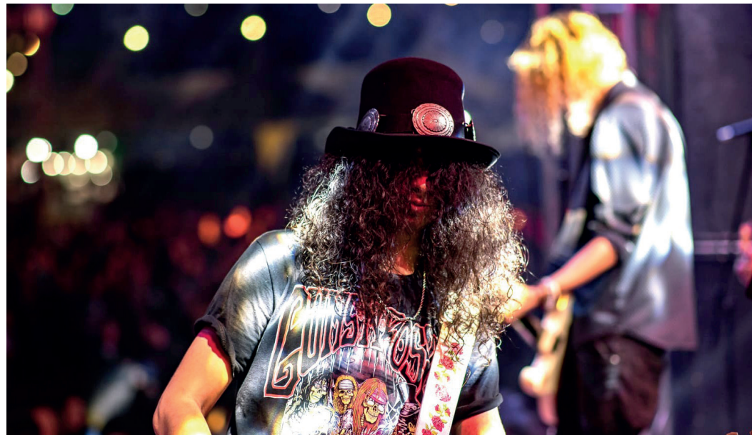
Fundada em 1991, a banda brasileira de tributo toca clássicos como "Sweet Child O' Mine", "Patience", "Don't Cry"

Fundada em 1991, a banda brasileira de tributo acumula marcos em sua trajetória de mais de três décadas. No mesmo ano de sua criação, o grupo foi contratado pela gravadora Geffen — selo oficial do Guns N' Roses na época — para realizar o show de lançamento dos álbuns Use Your Illusion na Avenida Paulista, em São Paulo, o que consolidou sua projeção no circuito de covers.