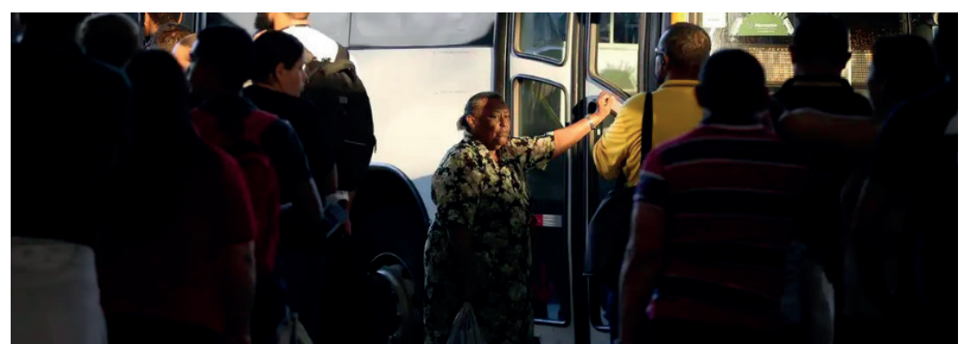
Nos últimos dez anos, o número de pessoas 60+ no mercado de trabalho saltou 53%

O emprego para pessoas com 60 anos ou mais tem crescido no Brasil proporcionalmente mais do que para outros grupos da população. No entanto, essas vagas vêm acompanhadas de mais informalidade, ou seja, sem carteira e sem proteção trabalhista. A informação é da Agência Brasil.