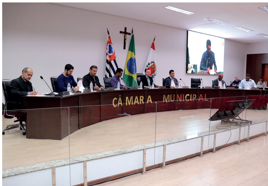
Na mesma sessão, o Legislativo deu aval à Lei de Diretrizes Orçamentárias (LDO) para o exercício de 2027

A Câmara Municipal aprovou, em duas sessões realizadas na última segunda-feira (8), o Projeto de Lei 37, que institui o Refis no município. O programa beneficia contribuintes com dívidas contraídas até 31 de dezembro de 2025, permitindo abatimentos que variam de 30% a 100% dependendo do número de parcelas escolhidas. Página 3