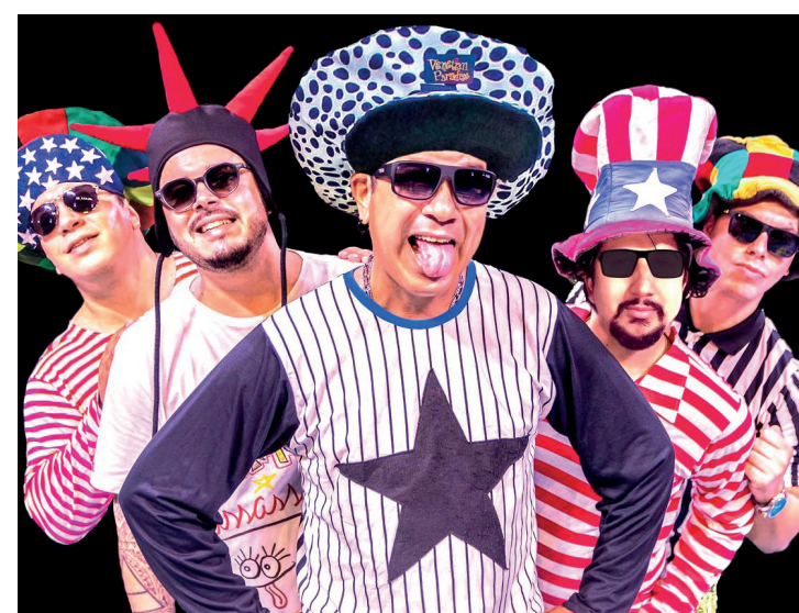
O tributo ao rock e Mamonas Assassinas acontece no dia 16 de julho, a partir das 19h30, na Praça de Alimentação

Banda Diet Music - Mamonas Cover será responsável por reviver os clássicos dos meninos de Guarulhos. O evento faz parte das comemorações do Dia do Rock e ocorre na Praça de Alimentação do centro de compras. Página 6