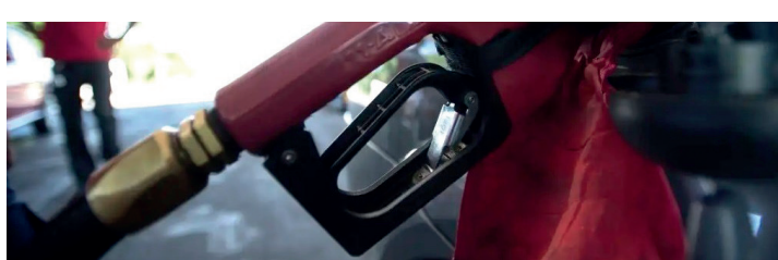
Por enquanto, preço do combustível permanece inalterado, mesmo diante do cenário internacional

Alta do barril para US$ 80 após ataques entre EUA e Irã faz Ministério da Fazenda adiar decisão sobre fim do subsídio de R$ 0,44 na gasolina. O ministro Dario Durigan analisará a retirada na próxima semana. Página 4