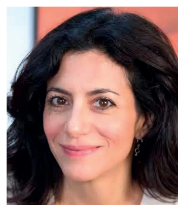
Programação conta com exibição do filme Califórnia, da cineasta Marina Person, que também faz palestra no evento

Banda Diet Music - Mamonas Cover será responsável por reviver os clássicos dos meninos de Guarulhos. O evento faz parte das comemorações do Dia do Rock e ocorre na Praça de Alimentação do centro de compras. Página 6